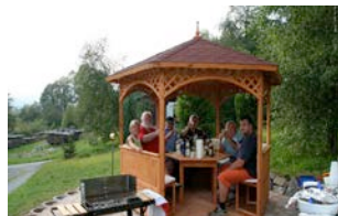
Pavillon mit Grillecke

Des Weiteren befindet sich direkt am Haus auch ein privater Kinderspielplatz.